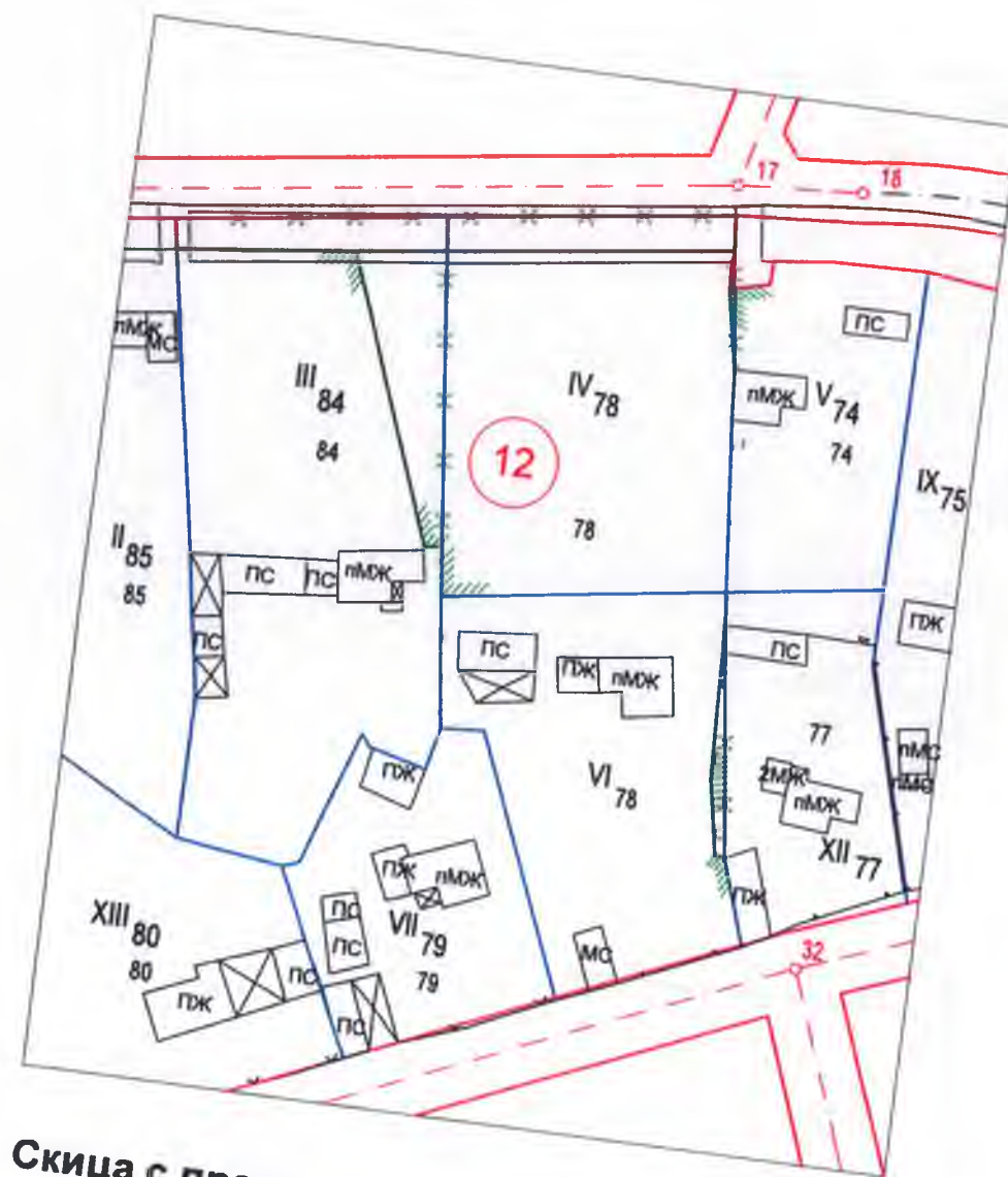
Скица с предложение за ПРЗ за частично изменение на ЗРП за част от кв. 12 по плана на с. Петко Славейков Регулационна съставка М 1:1000