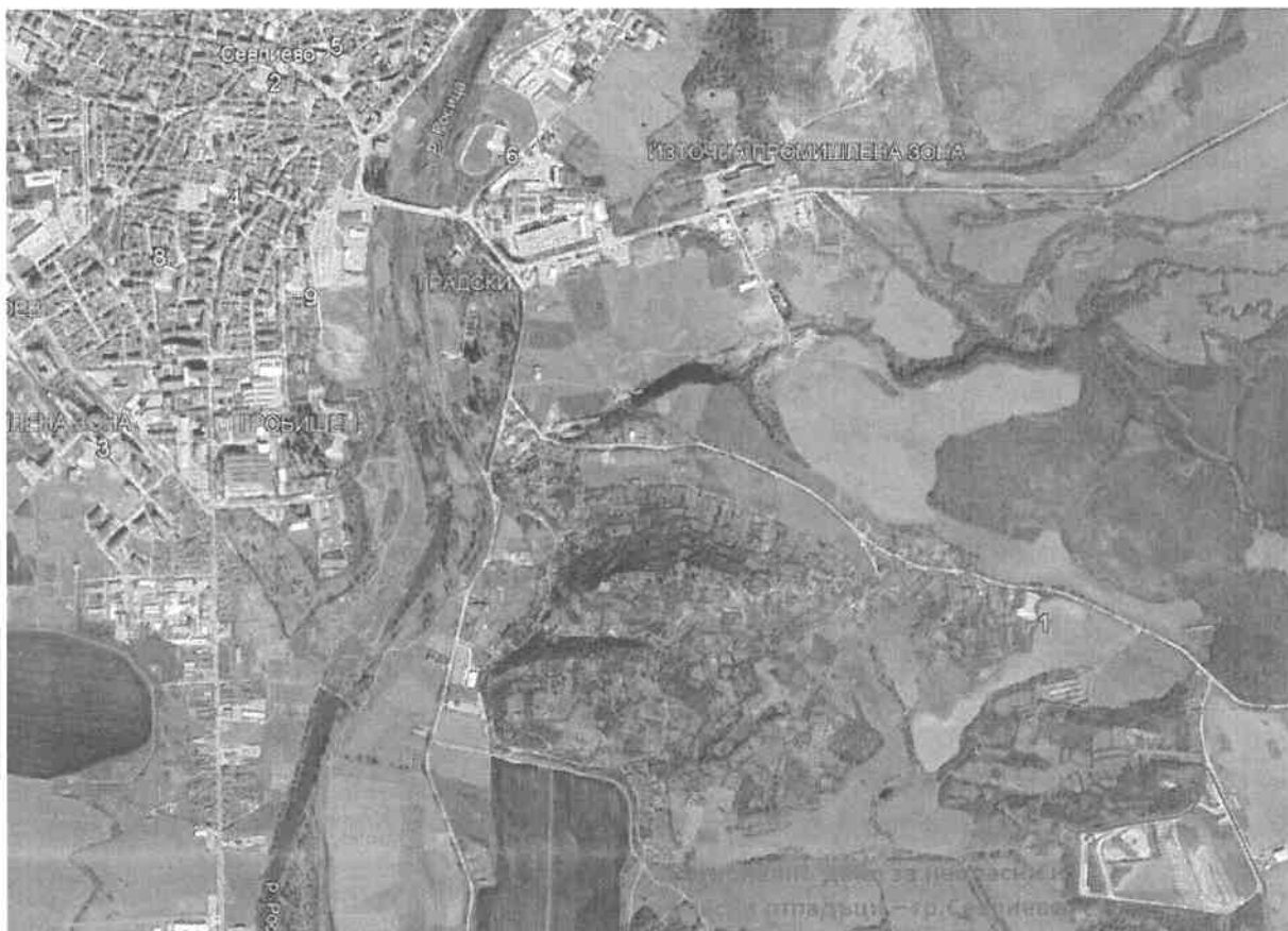
Фиг. 2. Обекти, подлежащи на здравна защита

Не се очаква въздействие върху незасегнат досега компонент на околната среда.