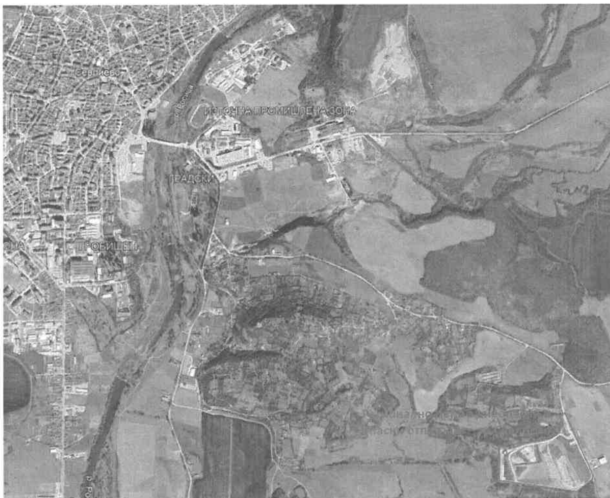
Фиг.1 Местоположение на „Регионално депо за неопасни и опасни отпадъци за общините Севлиево, Дряново и Сухиндол“

Имотът, в който ще се реализира инвестиционното предложение, е с площ 120 125 m 2 , идентификатор на поземления имот 65927.511.1 по кадастралната карта и кадастралните регистри, одобрени със Заповед РД-18-77/16.07.2008 год. на Изпълнителния директор на АГКК, с начин на трайно ползване – „депо за битови отпадъци (сметище)“. Копие от скица на имота е представено в Приложение 2.